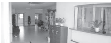
▲写真はイメージです。