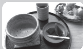
・天空カフェの営業時間は朝10時～夕方16時・不定休・お抹茶550円 コーヒー400円他