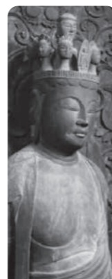
十一面観世音菩薩 (国指定重要文化財)