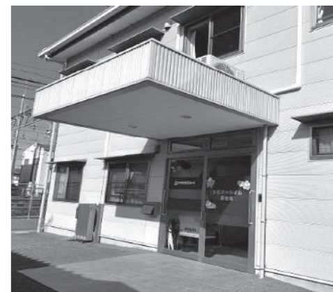
シルバーハイム新在家正面玄関