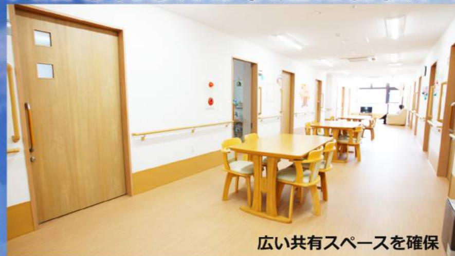
広い共有スペースを確保