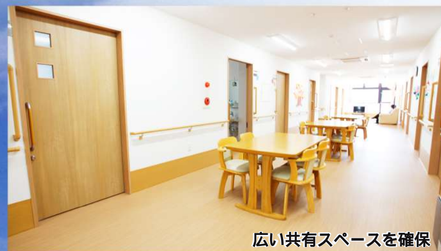
広い共有スペースを確保