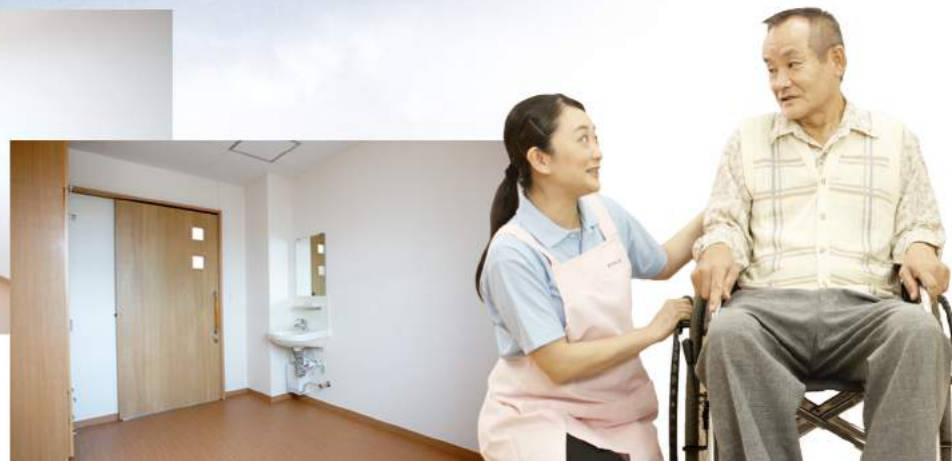
隅田(すだ)シルバーハイム間取図